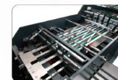
输送部 Conveyor unit