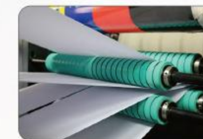
导纸设备 Web guide system