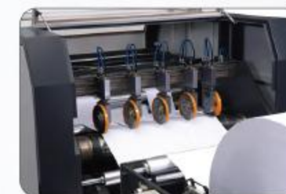
分条刀 Slitting knife