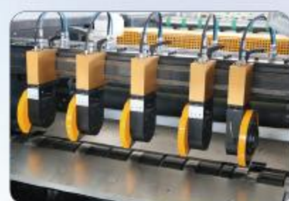
分条刀 Slitting knife