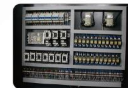
电器设备 Electrical equipment