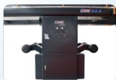
原纸架 Unwind Stand