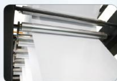
导纸设备 Web guide system