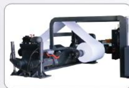
可选配置: 双臂油压无轴原纸架 Optional: Hydraulic Shaftless Unwind station