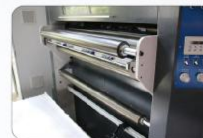
电动小反曲控制系统 Electric de-curl unit