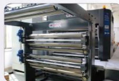
自动导边系统 Auto web guide system