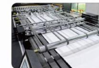
输送部 Conveyor unit