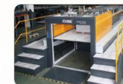
自动齐纸集纸设备 Auto Jogger System