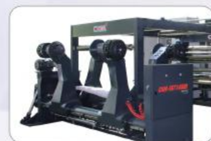
双臂油压无轴原纸架 Hydraulic shaft-less unwind station

CHM-SGT1400H/1700H High Precision Synchronize-fly Sheeter features fibre-less and clean cuts with high dimensional precisions. Best for board paper, art paper, kraft paper and packing paper or board etc.