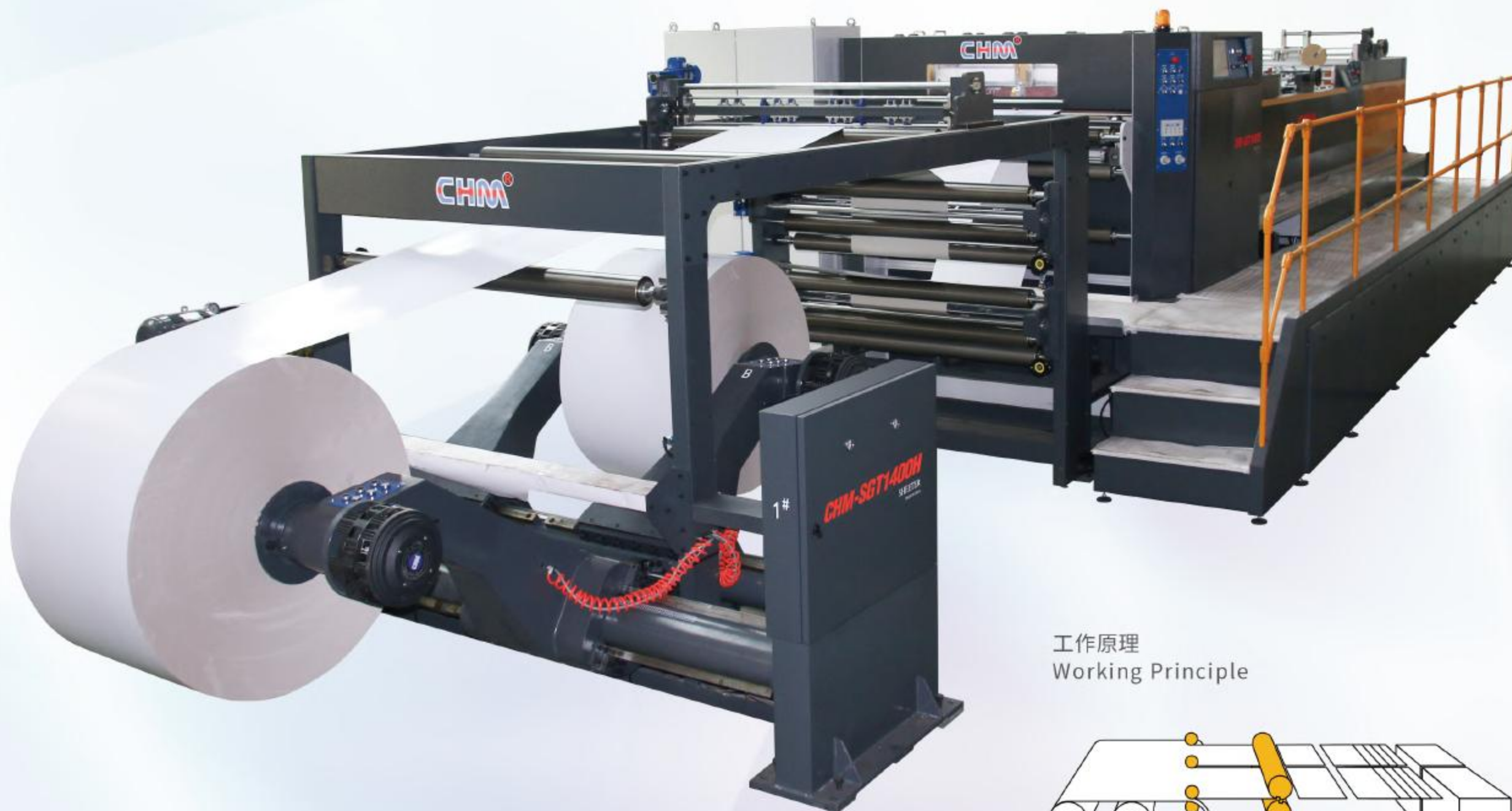
工作原理 Working Principle