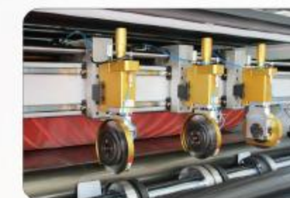
自动定位分条刀 Automatic position slitting system