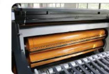
高精度双回旋横切刀组 High precision synchronic-fly cutting unit